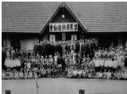
图2 20世纪20年代初集美学校运动会