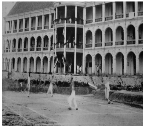
图 3 摄于 1924 年的集美学校网球运动场景

各校还兴建了室内体操室、乒乓球室。所有的这些设施分布在学校内,无校际之分,可以共同使用以及资源共享。为了让学生能够进行游泳实习和开展游泳体育活动,1922 年 10 月,陈嘉庚花费近 3 000 元在集美学校前建造了一个四周用石头砌成,底铺水泥,长 100 米,宽 33 米,高 1.7 米的游泳池。20 世纪 20 年代初集美学校还修建了网球场。图 3 是摄于 1924 年的一张集美学校旧照片 [7] ,图中集美教师正在进行网球比赛,它充分说明集美学校在开展西方体育项目方面走在时代前列,同时,先进的体育场地设施也促进了西方体育项目在中国学校体育中的传播。