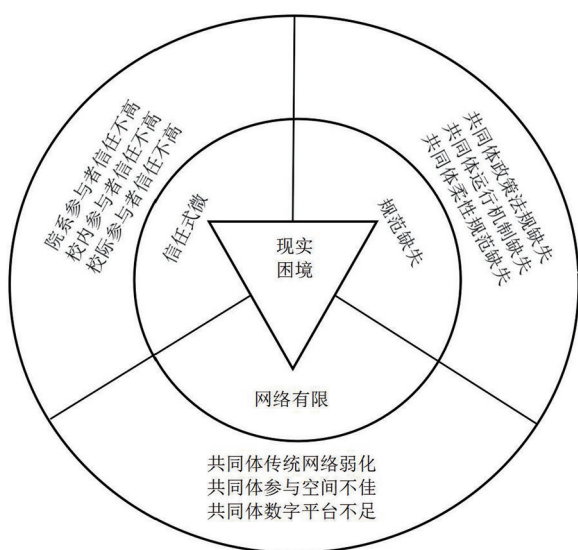
图2 高校体育课程思政教研共同体建设的现实困境